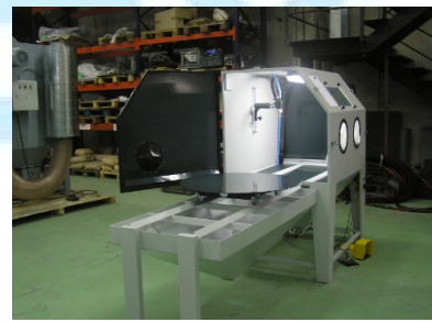
Mesa auxiliar de carga